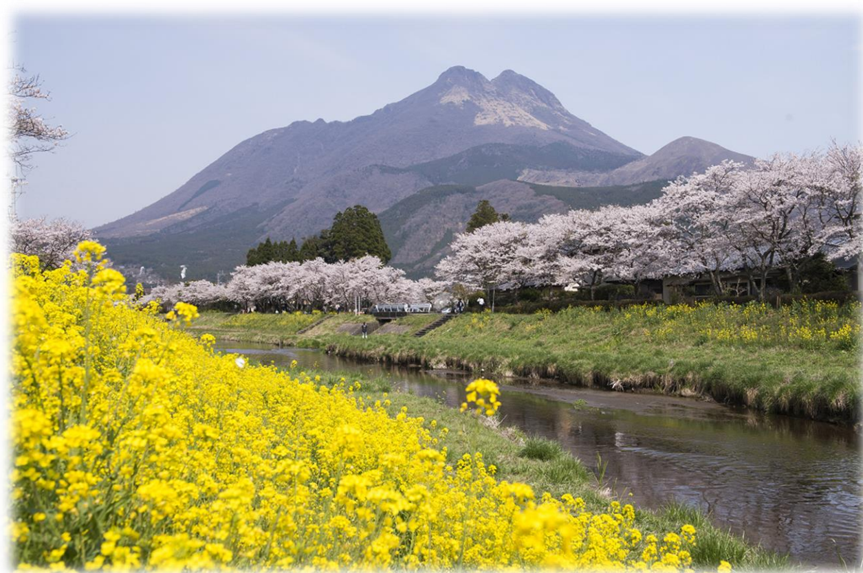
湯布院の春（由布市）