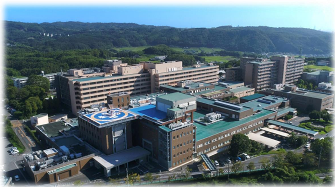
大分大学医学部附属病院 空撮